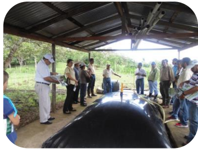
Sistema Biodigestor 20 m 3