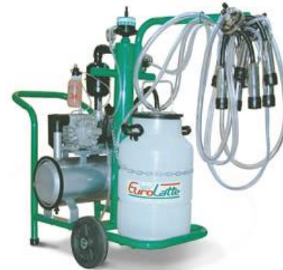
Ordeño Mecánico de 2 puestos móviles

*Inversión Total Ordeño Mecánico a Biogás: US$2,852